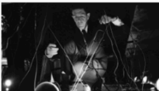
Music Is Everywhere