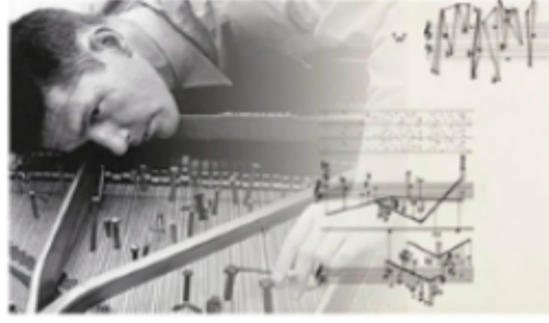
prepared piano John Cage Centennial Festival: W