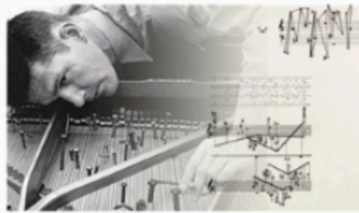
prepared piano John Cage Centennial Festival: W

John Cage and "Chance Music": How Free Can Music Become?