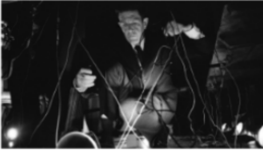
Music Is Everywhere